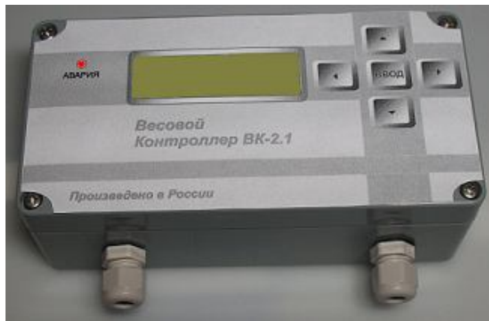
Рисунок 1. Внешний вид контроллера.

Внешний вид весового контроллера приведен на рисунке 1.